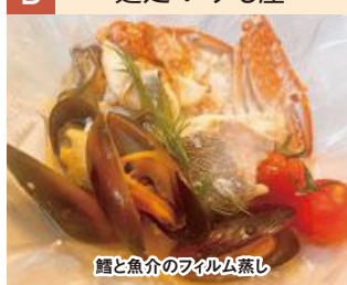
蟹と魚介のフィルム蒸し