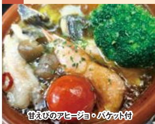
甘えびのアヒージョ・パケット付